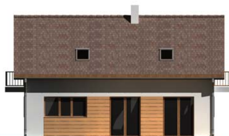
POHLED BOČNÍ (OBÝVACÍ POKOJ)